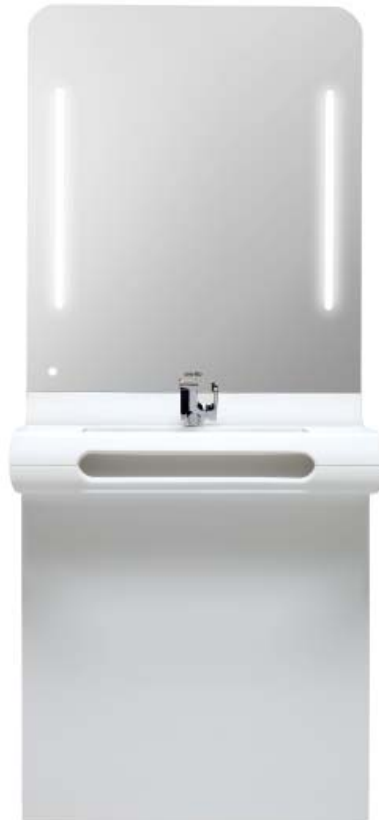
WASHBASIN WHITE ELEGANCE IN RESIN