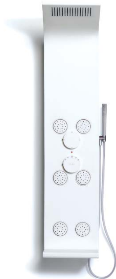
SHOWER PANEL SMOOTH AND COMPLETE