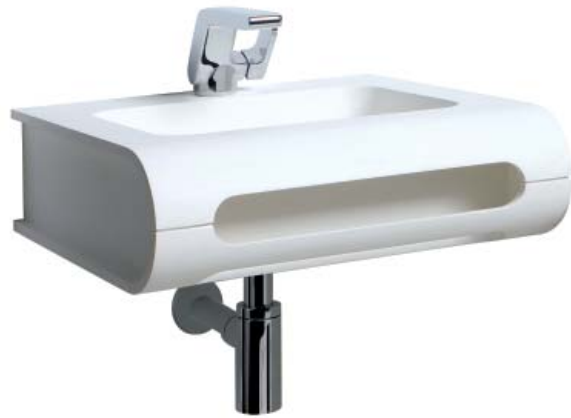
WASHBASIN SMART AND COMPACT