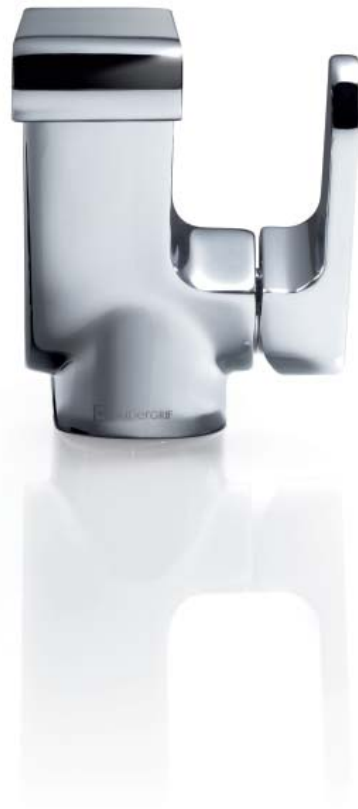
BASIN MIXER MODERN FLOW